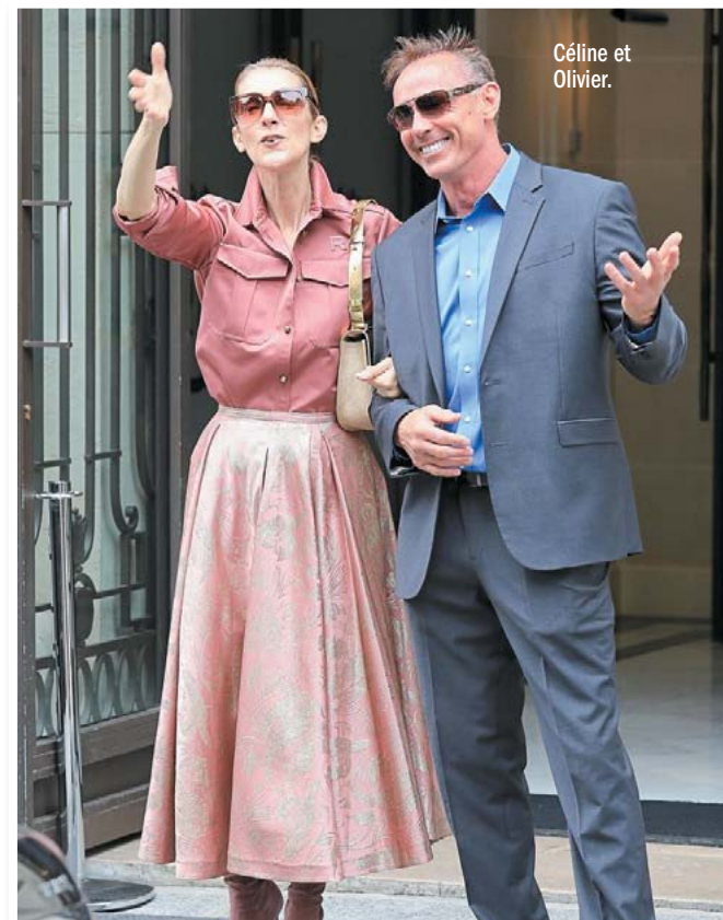
Céline et Olivier.

Après sa tournée européenne où elle a pu renouer avec ses fans et avoir beaucoup de plaisir à prendre la pose avec les plus grands créateurs de mode, Céline revient en Amérique et s'accorde quelques jours de repos ainsi qu'une visite éclair à Montréal. Elle remontera sur la scène du Caesars Palace à Las Vegas le 19 septembre prochain. Et qui dit grande tournée dit sécurité renforcée. Qui entoure notre belle Céline?