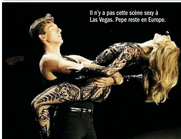
Il n'y a pas cette scène sexy à Las Vegas. Pepe reste en Europe.