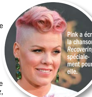
Pink a écrit la chanson Recovering spécialement pour elle.