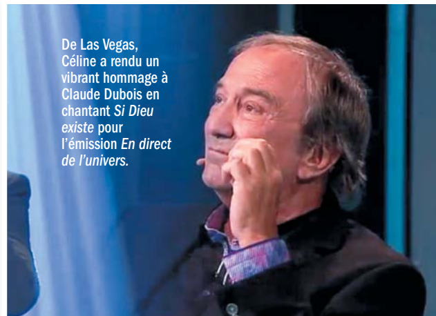
De Las Vegas, Céline a rendu un vibrant hommage à Claude Dubois en chantant Si Dieu existe pour l'émission En direct de l'univers .